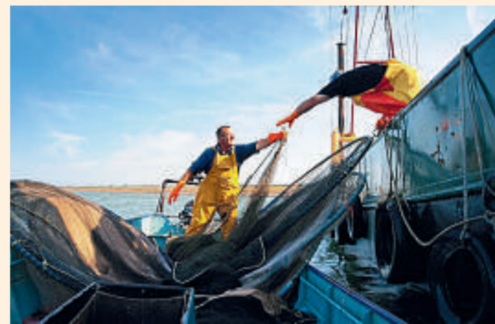
De visserijsector is gebaat met de innovaties in de textielbranche.

van. 'Met Clarysse hebben we gewerkt op handdoeken op basis van sojavezel. Die zijn zacht, vochtabsorberend en drogen sneller dan eender wat. Met enige marketing kan je ze zo onderscheiden.' Centexbel is trouwens ook buiten België een grote naam. Het is bijvoorbeeld een van de twee instellingen die in opdracht van de Verenigde Naties vluchtelingtenten keuren.